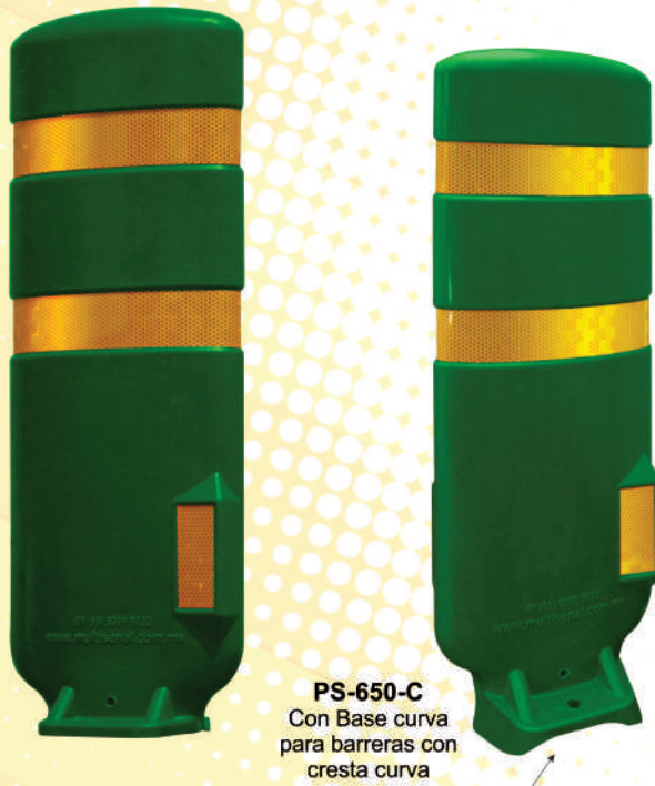
PS-650-C Con Base curva para barreras con cresta curva